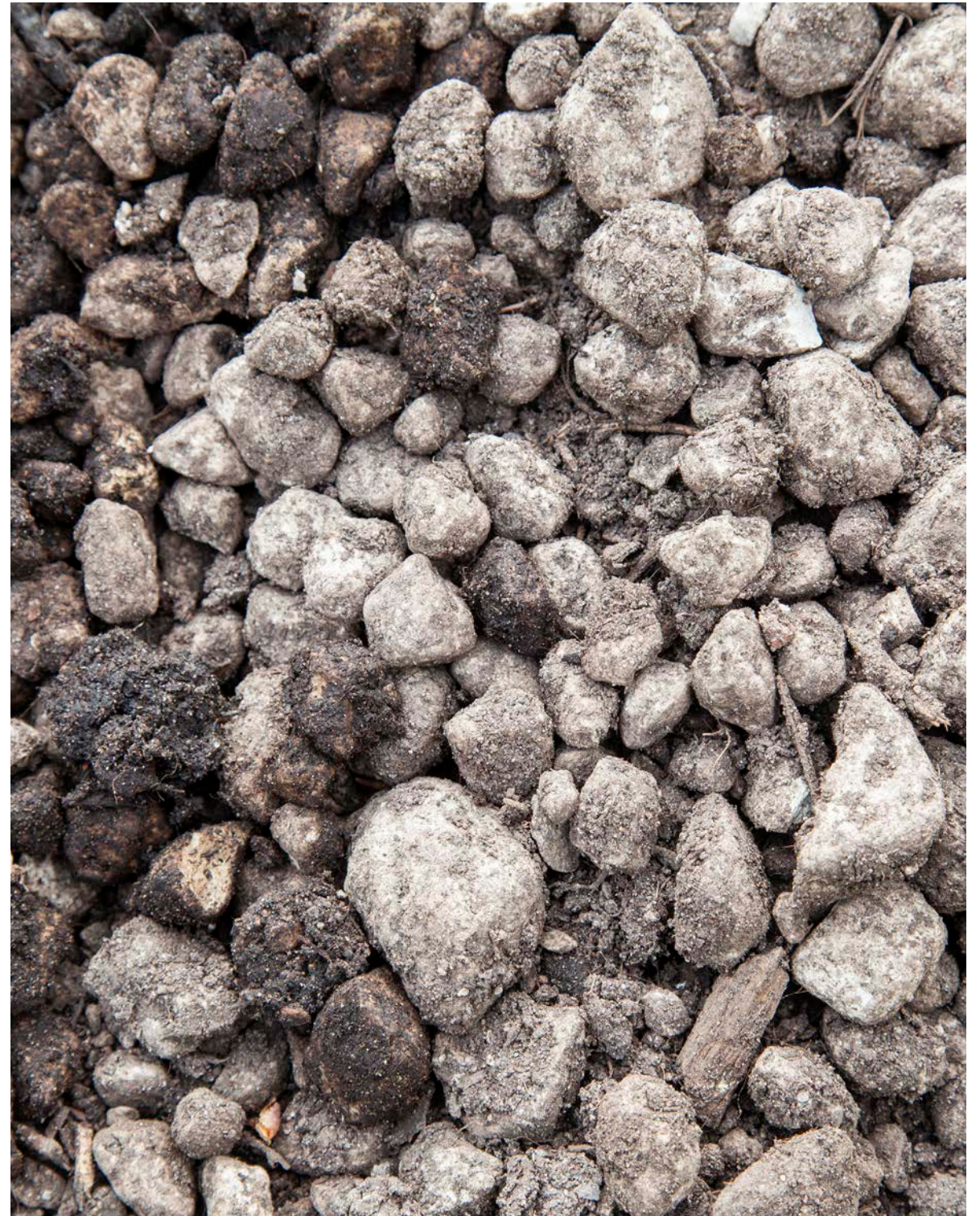
Hekla Pimpstensskelett består av Hekla Coarse, grönkompost och mineralmix. Pimpstenen säkerställer att trädets rötter får bra förutsättningar med tillgång till både syre och vatten över lång tid.

Träden som flyttats efter omvårdnad i depåodlingen är nu en del av nya fina parker runt om i Göteborg. När träden flyttades så planteras de i Hekla Pimpstensskelett. Både träden som flyttades till odlingsdepåer och de träd som flyttades direkt till sin nya plats i staden planterades i Hekla Pimpstensskelett. Träden som lyftes upp från odlingsdepån uppvisade ett mycket gott resultat av finrötter. Hekla Pimpstensskelett levererade friska och livskraftiga träd för återplantering i Göteborg.