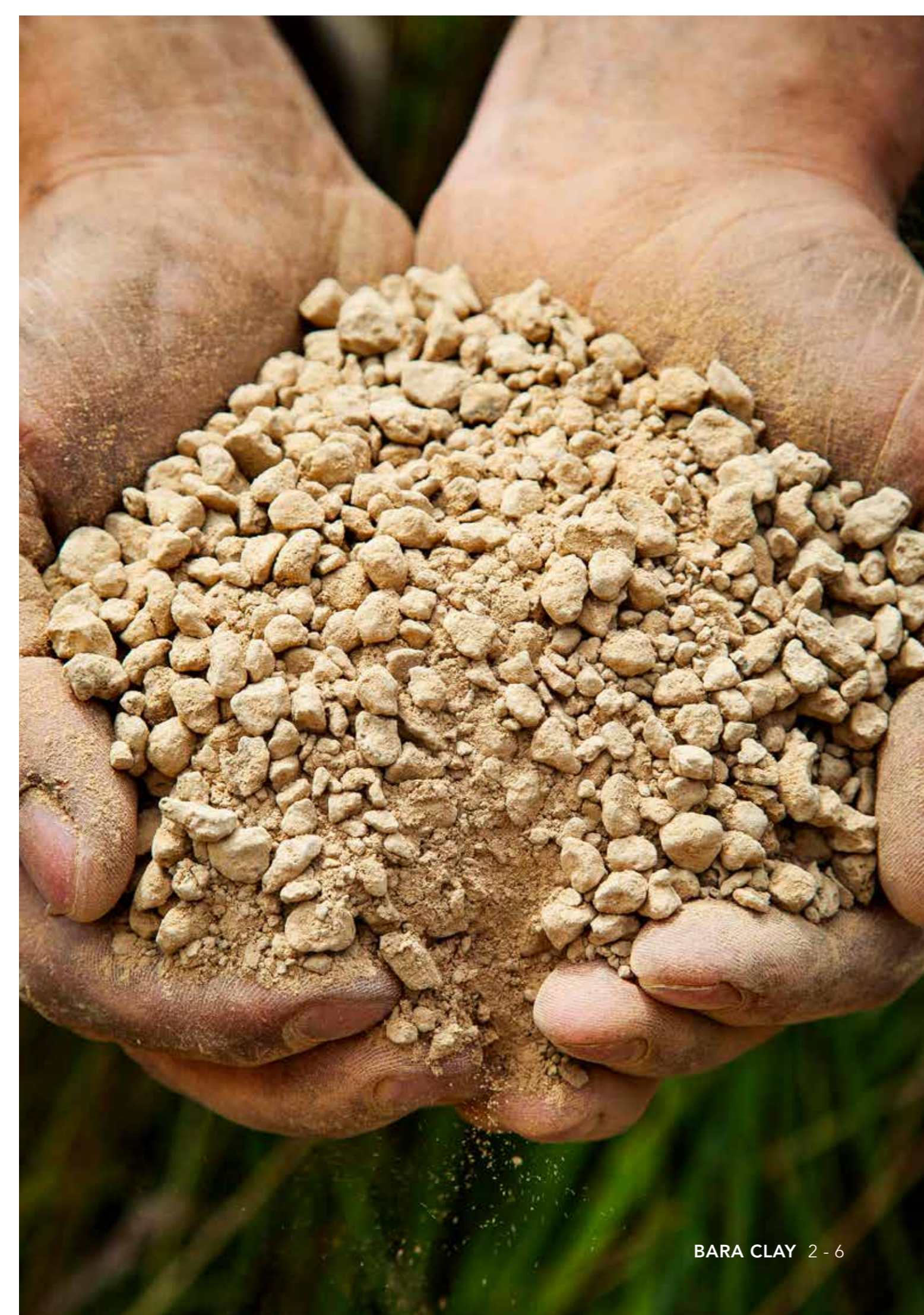
BARA CLAY 2-6