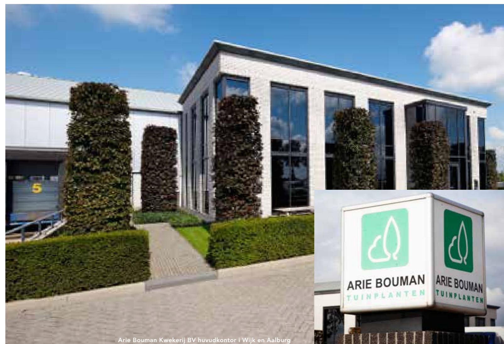
Arie Bouman Kwekerij BV huvudkontor i Wijk en Aalburg